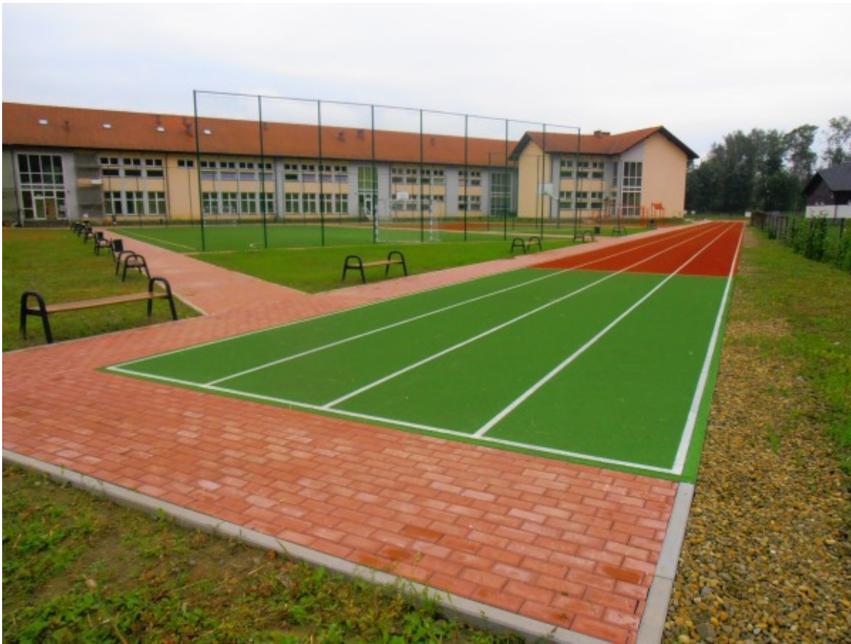
Plac zabaw za Gimnazjum